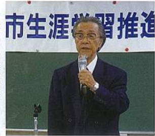
市生涯学習推進協議会

(2)生涯学習推進のための情報の提供に努めたいと思ふ 市民が自主的、主体的に生涯学習活動を行うために、学習の機会や場の提供に努める。講師、指導者などの情報の取