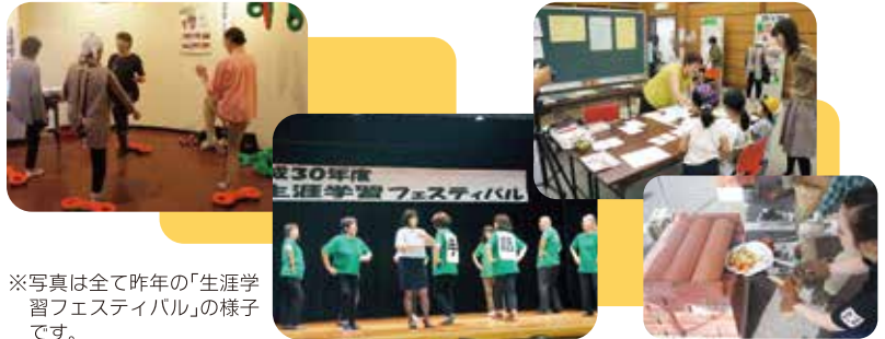
※写真は全て昨年の「生涯学習フェスティバル」の様子です。