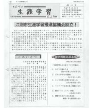
「ら・ら」の前身である「えべつ生涯学習だより」創刊号の発行から20年がたちました。

きる場が必要になってきていたのではないかと感じています。最後になります。最終の機会に寄稿させて頂き感謝申し上げます。