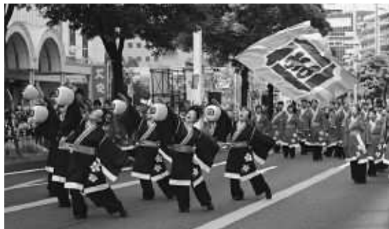
ヤサエンヤサーのまつことええのソーランよー