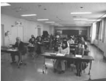
キーワード「家族は記憶の共同体」