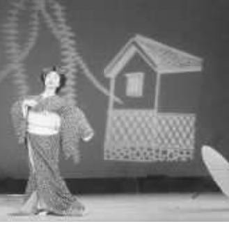
民謡、舞踊、マジックショー…