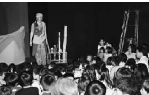
生の舞台の迫力に、みんな感動です