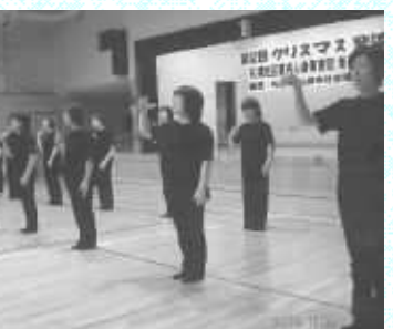
「手話歌あやとり」歌の表現にチャレンジ！

「あなた達耳の聞こえる人は手話の勉強に飽きたらもう辞めた」っていつでも投げ出せるけど私達耳の聞こえない者は一生辞められないの。是非永く続け