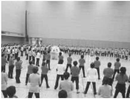
「うっさん」を囲んで体操です!

2009年7月3日に札幌市内の「きたえーる」にて同大会が行われ、江別からは26名が参加しました。貸切バスに揺られ、車内で雰囲気も盛り上がり、さあ到着したら体操です！マスコットキャラクターの「うっさん」と一緒にリズムに乗り、グループごと