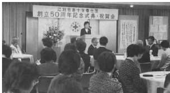
「更に60年に向かって研鑽、努力を…!」