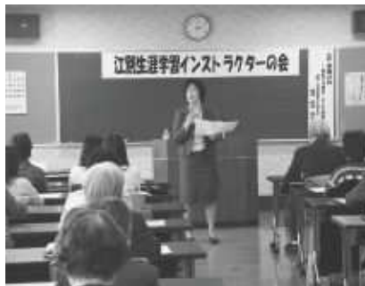
1番大事なものはなんですか?

めてくれる大人や継続的に支えてくれる人の存在が、救いとなる事実がある。」と、地域や周囲の理解力とかかわりの重要性を話され、家族だけ、地域だけでは成り立たないのが家族であり支援できる地域の力の必要性を説かれていました。