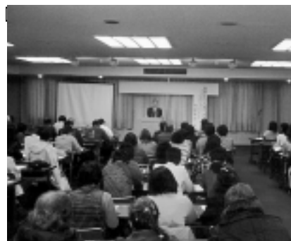
昨年の講演会の様子