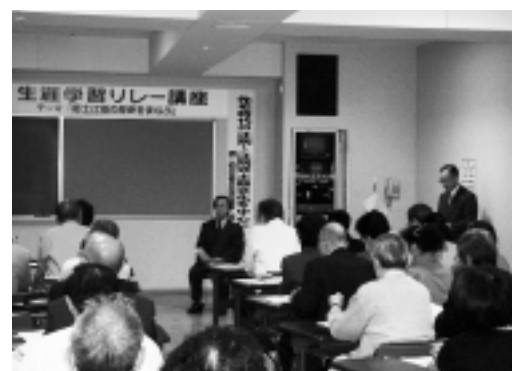
リレー講座の様子