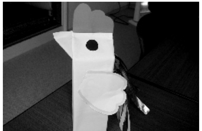
完成した『にわとりこっちゃん』

絵本の読み聞かせが本来の「おはなしなあに」の活動ですが、毎週のお話会のプログラムにも工作は欠かせないものになっています。何年か前に参加されているお母様たちに、絵本やプログラムの内容などについて、ご意見を伺ったことがあります。そのときに、工作を大変楽しみにされているという意見が多く寄せられました。親子で工