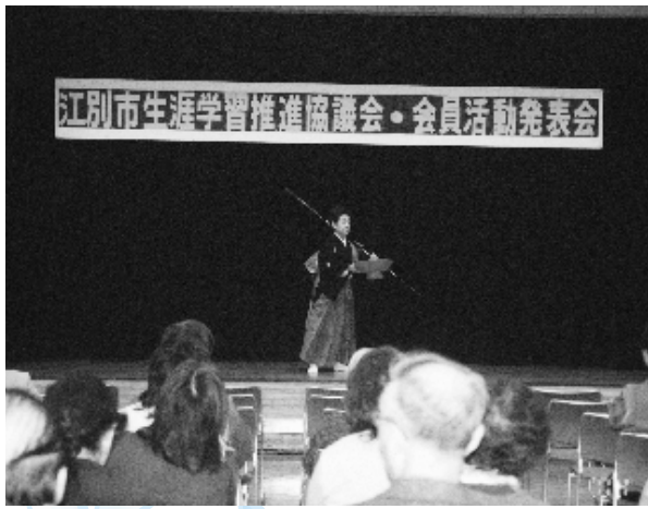
江別市芸能赤十字奉仕団の発表風景

芸能赤十字奉仕団の方々による民謡・舞踊で幕が開き多様な会員各団体の活動発表が続きました。それぞれが実績のある団体でその活動内容の説明や日々の様子が次々と発表され、栄養士会の方のお話には、日頃の食生活の反省を、また3B体操の熱気に会場全体がつかまれました。