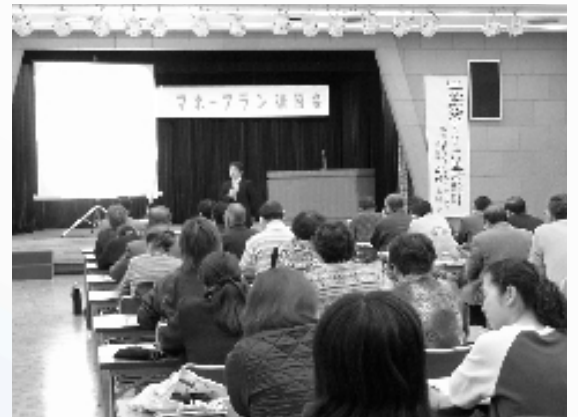
講演会には多くの市民が参加しました

国際交流協会の皆さんの歌声で会場が楽しい雰囲気になったところで幕が下りその後会員相互の交流会となりました。今まで知らなかった各団体の方々と理解を深めこの活動発表会が一般の方々にもっと知っていただくことが市民のための生涯学習として大切なことだと意見交流されました。 (おはなしなあに 松山)