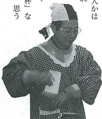
主婦から主夫へ…21世紀は役割分担？

「鶏肉の削ぎ切り、たまねぎはたてに薄く、ねぎの小口切り、大きじ一杯、カップ一杯」など料理用語も盛り沢山。思うようにはなりません。それでも2時間で何とか出