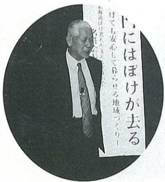
ぼけ防止に笑いが一番と…