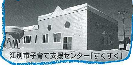
江別市子育て支援センター「すくすく」