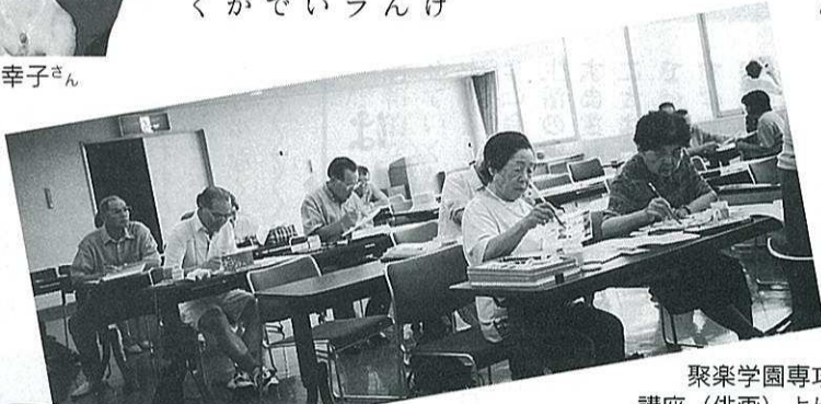
攻専学園楽聚 より(俳画)講座