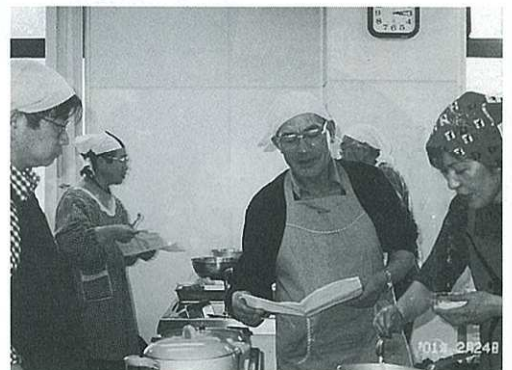
なるほど…感動の連続です。

「今は、食べることが日常生活の中であまりにも簡単にすまされていますが、食べることは私たちが生きていく上で、何よりも大切なことです。」との講師の言葉のあと、参加者は献立の親子丼、すまし汁、野菜の炒め物に挑戦。でも現実には厳しいもので普段から台所に立ち、料理を作っている人か、食べる人かはこの場の様子に現れます。