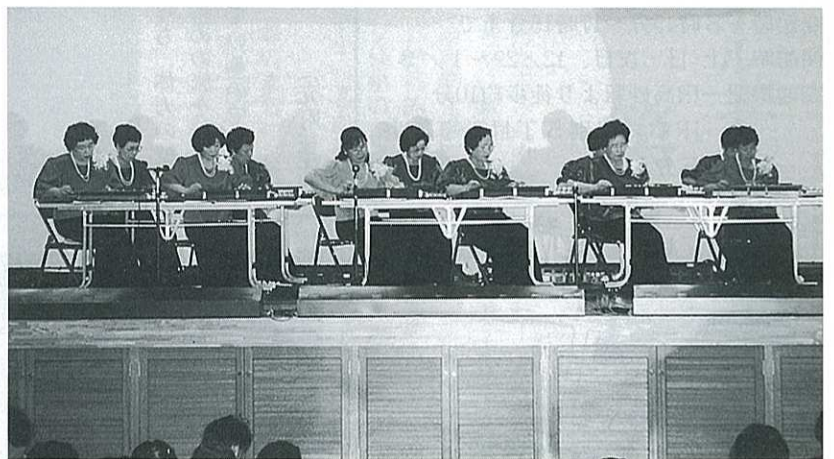
他教室との交流演奏会

この楽しみを自分達だけのものにせず、大正琴との音色を多くの人々に楽しく親しく頂くため各種イベント・施設訪問等にて演奏をしています