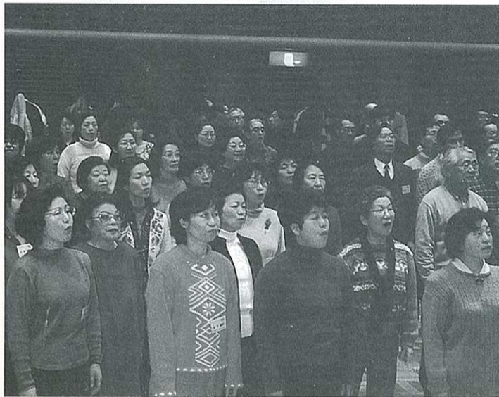
熱気がムンムン…第九の練習風景

「気な江別」の創造と新しい地域文化を広めようと市民が十カ月余の練習を重ね、つくりあげます。同じ「えべつ」のまちに住む仲間たち、初めての出会いもあつたことでしょう。21世紀の幕開けにふさわしい演奏会にしたいと、練習もパート別練習十二回、全体練習二十回をそれぞれがこな