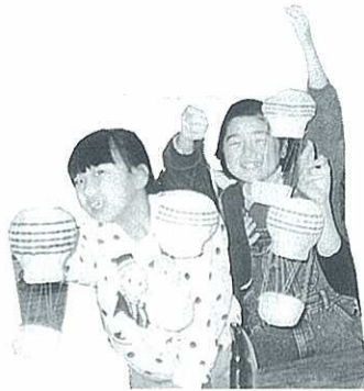
わ〜い、できたできた

私の「生涯学習」といえるかどうか解りませんが、中学時代からやっている「卓球」かも知れません。