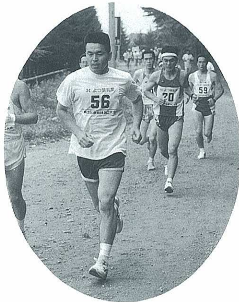
原始林クロスカントリー大会にて

いっばいおしゃべりをし、勝負にこだわることなく楽しい卓球ができたらいいなあと思っております。