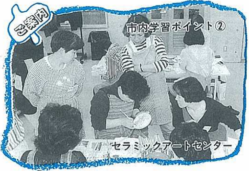
市内学習ポイント②