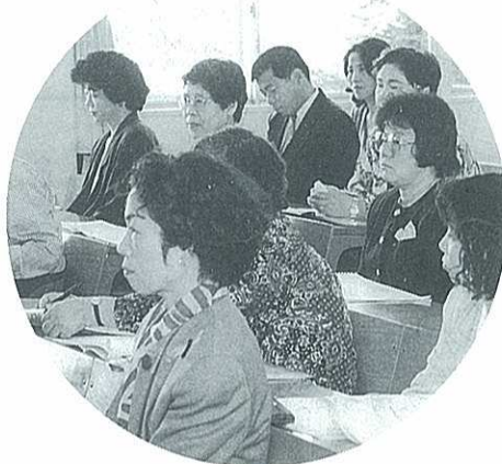
今年も百講座を用意しています。