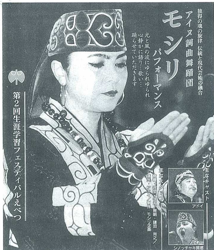
第2回生涯学習フェスティバルえべつ

の讃歌」(映画監督・千葉茂樹)と絶賛されています。シンセイザイザーとムックリ(口琴)の共演など、現代精神と原初の魂の融合、そして超克が予感される、きわめて刺激にみちた舞台です。 ▽11月17日(日)13時開演 市民会館大ホール 大人2千円、高校生以下千円(全席自由、当日500円増) 市民会館・各公民館にて発売中。ぜひお越しください。