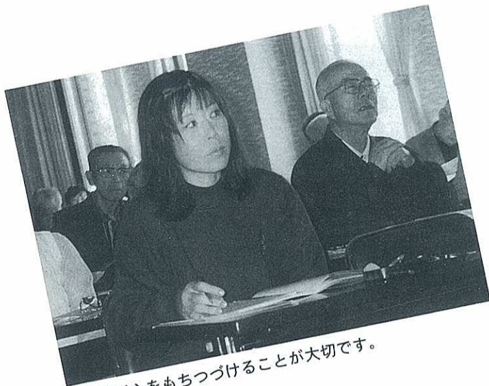
学ぶ心をもちつづけることが大切です。