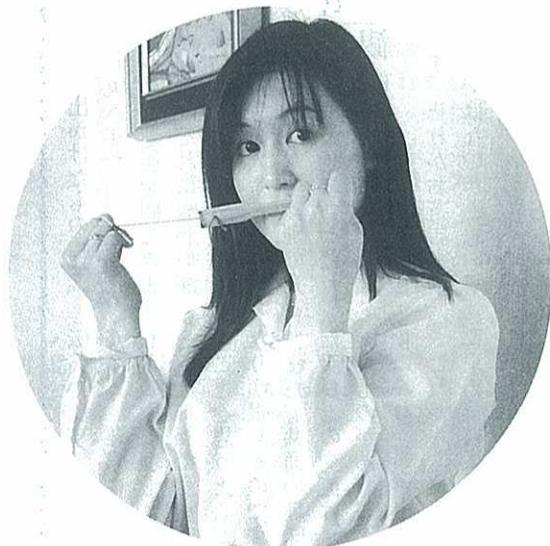
ムックリ(口琴)に挑戦しました。