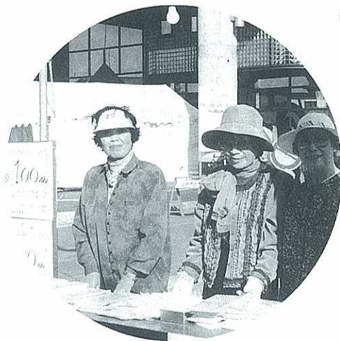
恒例行事のひとつ「割りばし販売」

あなたも入会しませんか。会員には、入館料免除、会報のお届けなど、多くの特典があり、学習会にも参加できます。普通会員は年会費3千円。詳細は資料館☎385-6466までどうぞ。