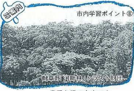
市内学習ポイント®

北海道へ帰った翌日から炊事をしなければならぬのですからこの鍋も一緒に日本海の船旅を経て持ち帰ったようです。とほしい配給の食糧を煮炊きし、懸命に一家の栄養確保に汗を流した母の姿をこの鍋と共に思い出します。