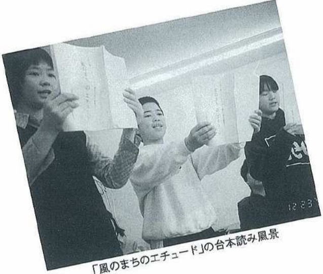
「風のまちのエチュード」の台本読み風景

またクラブ等でも一人暮らしのお友達に時々電話し、お話しの手をさせていただいたり、邪魔させていただいたりしております。