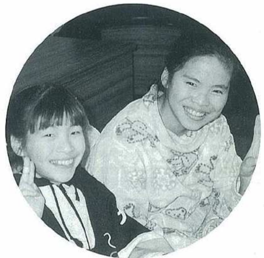
わたしたちも出演します 見に来てネ… ライブリィのメンバー。

そんな時、スーザンオズボーンの歌声、彼女の一声を聴いただけでやすらぎや勇気、愛というものが、たちのぼってくるのです。生の歌声にふれたい、私自身も元気勇気を伝えられるような何かを持ちたいと思っておりますたら、奇