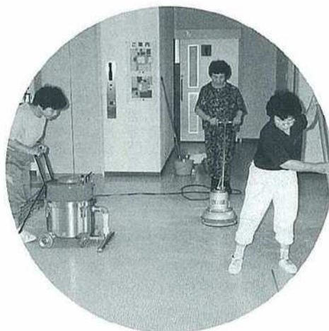
仕事の種類はいろいろあります