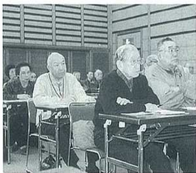
21Cのまちづくりを学ぶ

今回の研修会は、生涯学習のまちづくり推進における自治会活動の重要性を、あらためて知らされたものでした。