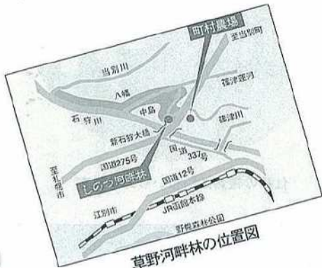
草野河畔林の位置図

から差し込む木漏れ日は、都会の心を和ませてくれます。林内にはログハウス風の小屋が建っていて、自然学習のために植物や野鳥などの図書が200冊余備えつけられています。◇入場は無料だが、事前の申込が必要◇草野「河畔林」トラスト財団の連絡先 ☎381-0550 / 上江別西町1番地