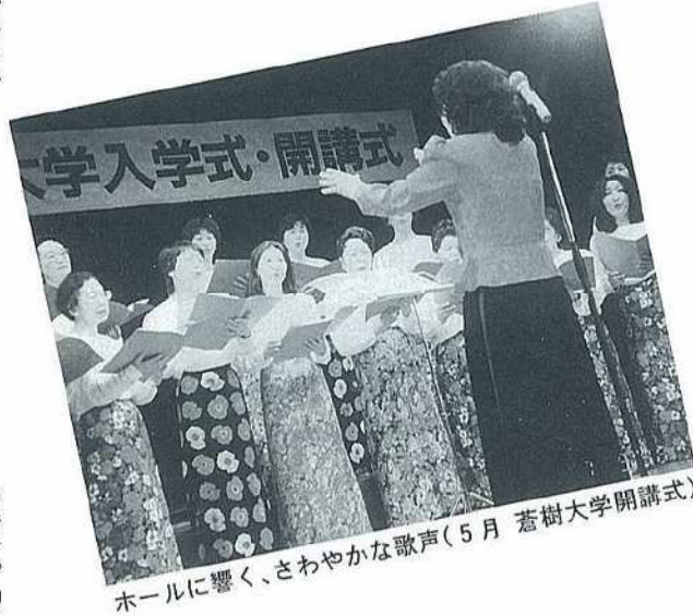
ホールに響く、さわやかな歌声（5月 蒼樹大学開講式）

長続きのコツは仲間がいること、それから「自分のレベルはこの程度しかありませんが、よろしく」という謙虚な気持ち、これさえあれば何事も楽しく続けられることうけあいです。（江別市民国際交流協会会員）