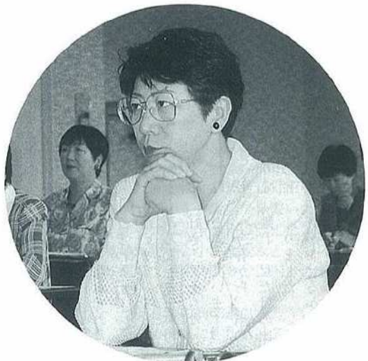
社会の主流に参画するにはなにが必要なのか?

リキユラムで学習しました。ジェンダー、性別役割分担意識、エンパワーメント、などなど女性をめぐる問題には新しい概念が導入されているため、聞き慣れない言葉もたくさん出てきましたが、受講者四〇名は回を重ねることに質問が多くなり、講座への関心の高さがうかがえました。これからの社会は「個」を認め合う社会であり、その「個」の半分の女性が自立し、そのパワーをどう社会に生かしていくかが大きなカギとなります。