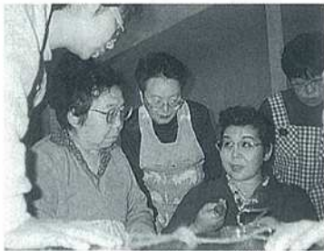
多くの市民に学ぶ機会を提供します

会費問題については、平成7年3月の本会設立以来の懸案事項として理事で組織する組織運営検討部会、総務委員会において会員の意向も重視しようとしてアンケートを実施するなどして慎重に論議してきました。 その結果、現在、当会は市の補助金だけで運営しているわけであり、やはり市民主体