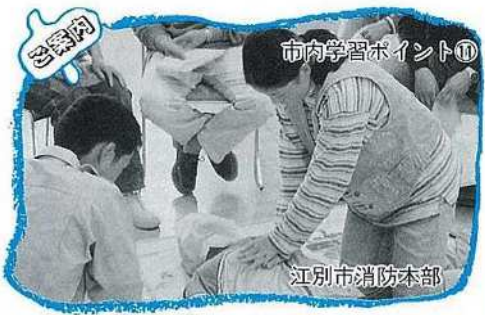
市内学習ポイント⑩ 江別市消防本部

後生に遺せといっているのです。岩波文庫でわずか五八ページの小著ですが、読むたびに天上からの贈り物を見るような奇跡的な輝きを感じて目の覚める思いがします。（錦町在住）