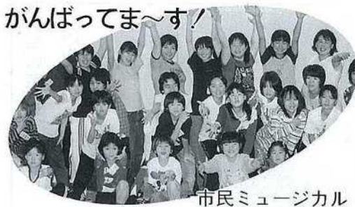
市民ミュージカル

生涯学習指導者研修会が、3月5日(金)午後1時30分から野幌公民館で開催され七三名の公民館教室講師、サークルの指導者、団体のリーダー、教育関係者が参加し、「公民館活動と生涯学習」について