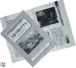
手軽な 手引書・ガイド普及版

いずれも、希望者には公民館等市内公共施設で無料配布していますので、ぜひお手に取りいただき、ご活用ください。なお、No.4の主な情報は次のとおりです。