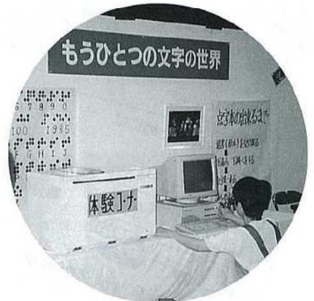
点訳の普及活動にも意欲的です