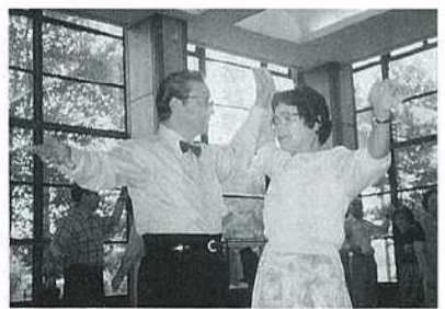
新しいこと、はじめてみませんか