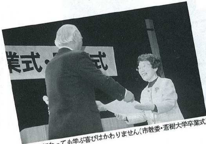
いくつになっても学ぶ喜びはわかりません(市教委・萱樹大学卒業式)

仕事の後の練習は決して楽な日ばかりではありません。しかし、不思議と「今日は休みたいな」と思ったことがないのです。江別まつことええチームに入り今年で四年目。メンバーは、小学生や私の両親と同じくらいの年代の方など様々です。私がYOSAKOIを楽しみ、これからも続けていきたいと思う気持ちは、踊っているとこの感動だけでなく、チームの人達のやさしさ、暖かさに出会えたことに、一番感動しているからかもしれません。(江別まつことええチーム会員)