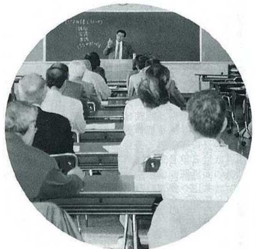
多くの市民に現代的課題に対応した学習機会を提供 (第4回生涯学習講座「アジアと日本」)

いかなる団体でも、団体独自の自主財源があつてこそ、主体性を確立することができます。つまり、会費を納める