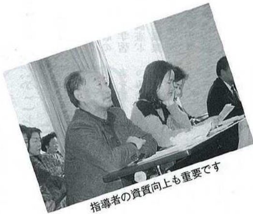
指導者の資質向上も重要です

を深めておりました。公民館活動が「自分づくり」「仲間づくり」「地域づくり」の拠点として、地域における市民の学習ニーズに答え、教養の向上、健康の増進、生活文化の振興、社会福祉の増進にとめなければならないことを学び、今後の学校週5日制への対応やボランティア活動の拠点としての役割など、地域の実情に即した公民館活動のありかたについても考え