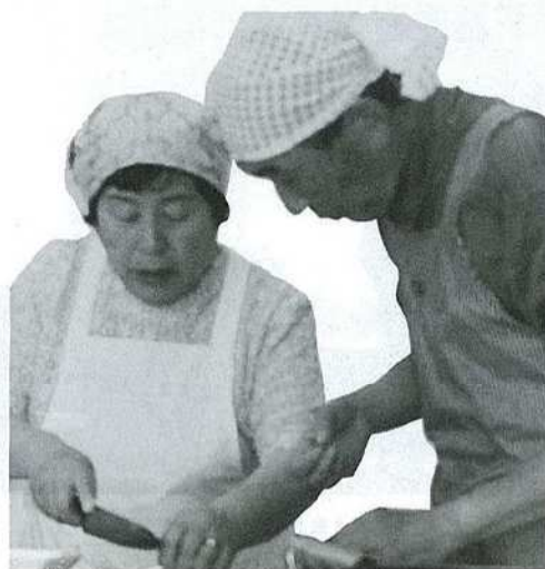
料理は愛情 ウデは後からついてきます。(蒼樹大学学習風景)