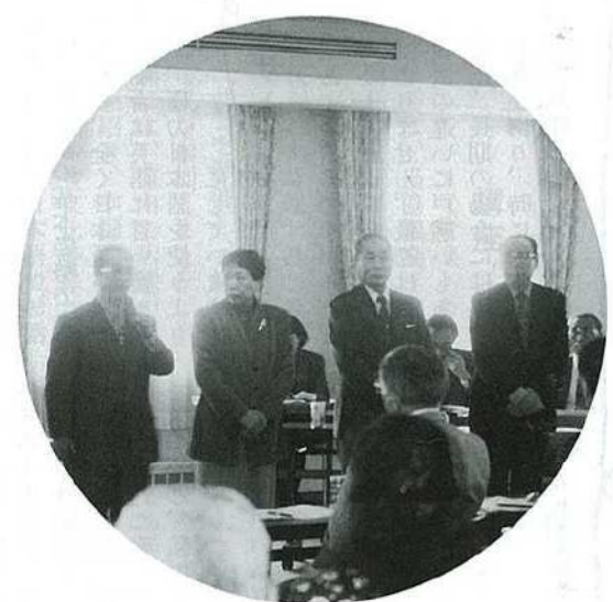
決意もあらたに新三役のみなさん。世紀をまたいでの執行部です。

私の大学でも生涯学習センターを中心に、地域の学習ニーズに応える各種講座を実施しております。また平成12年4月に「生涯学習システム学部」を新設する予定です。これからも開かれた大学として、地域のみならずと共生き共に学び、一層の連携を深め人づくりのまちとして発