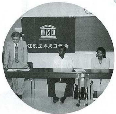
外国人ゲストを囲んで学習例会

協会の目標から、その活動はどうしても堅苦しいものになりがちなので、できるだけやさしいテーマで、理解しやすい内容にするよう努力して